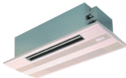
декоративная панель PMP-40BMW